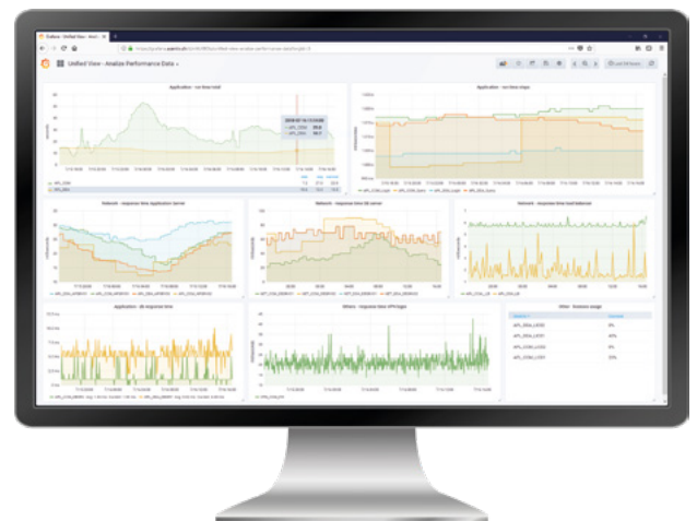
Unified View in Grafana Dashboard