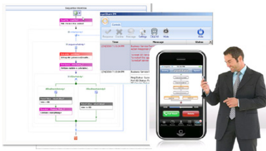
Mobile App zur Kontrolle von Workflows